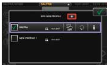
Sisältää profiilit kuljettajille ja työkoneille, joita on helppo muuttaa mistä tahansa näytön valikosta. Kaikki asetusmuutokset tallennetaan valittuun profiiliin.