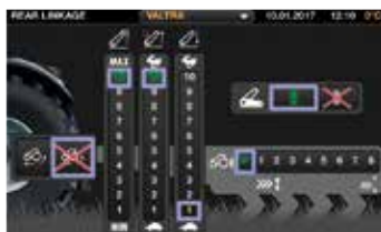
9" kosketusnäyttö, suuret ohjaimet, asetukset ja toiminnot on helppo ymmärtää.