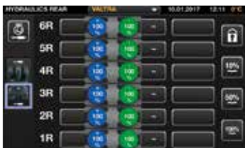
Voit nimetä minkä tahansa ohjaimen käyttämään mitä tahansa hydraulitoimintoa, mukaan lukien etu- ja takahydrauliventtiileitä ja etukuormainta.