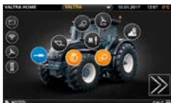
Helposti navigoitava valikkorakenne.

Valtra SmartTouch on nostanut käytettävyyden uudelle tasolle. Se on intuitiivisempi kuin älypuhelimesi. Asetuksia on helppo käyttää kahdella napautuksella tai pyyhkäisyllä, ja kaikki tekniikka on integroitu uuteen helppokäyttöiseen muotoon: automaattiohjaus, ISOBUS, telemetria, AgControl ja TaskDoc. SmartTouch on vakiovaruste Versu- ja Direct-malleissa.