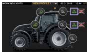
Työvalot on helppo konfiguroida 9" kosketusnäytöllä. Käsinojassa on myös työvalojen ja varoitusvalon virtapainikkeet.