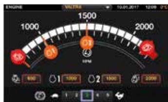
Asetukset voidaan määrittää loogisesti pyyhkäisyyleillä. Kaikki asetukset tallentuvat automaattisesti muistiin.